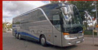
S 416 HDH Stångåbuss, Linköping