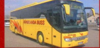
S 415 GT-HD Skalls Buss &amp; Taxi, Färgelanda