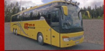
S 416 GT-HD KR Trafik, Östersund