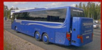
S 416 GT-HD Horredtrafiken, Horred