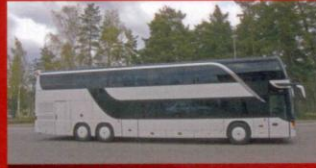
S 431 DT Lindbergs Buss, Örebro