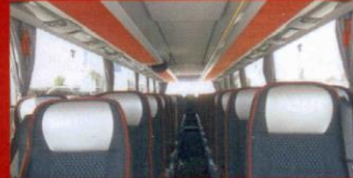
S 416 GT-HD Ljungskilebuss, Ljungskile