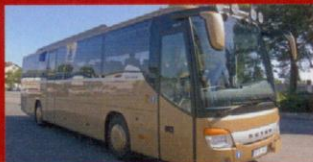
S 415 GT Söderbergs Taxi, Kålarne