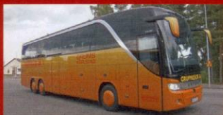
S 416 HDH Gruppresor, Karlstad