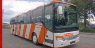
S 416 UL KR Trafik, Östersund