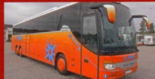
S 417 GT-HD VL-Buss, Vänersborg