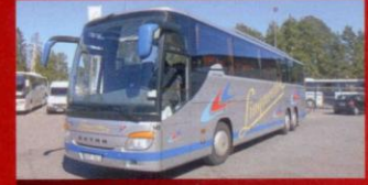
S 417 GT-HD Lingmerths, Tranås