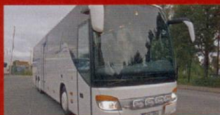
S 416 GT-HD Tjust Buss, Hjorted