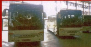
S 417 UL Grimslövsbuss, Grimslov