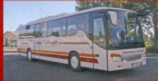
S 415 GT Fridströms Busstrafik, Rimbo