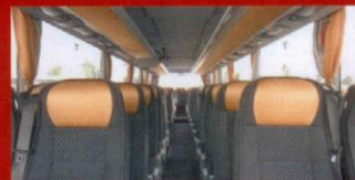
S 416 GT-HD Trossö Buss, Karlskrona