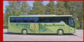
S 415 GT-HD Busspersson, Hammenhög