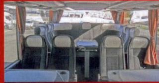
S 415 GT-HD Lindbergs Buss, Örebro