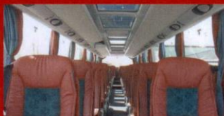
S 416 HDH Hagestad Touring, Löderup