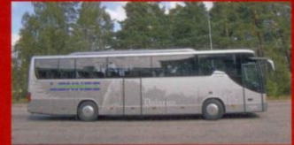
S 415 GT-HD Lennes Buss, Borlänge