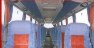
S 416 HDH Bussapågarna, Staffanstorp