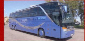
S 417 HDH Stigenbuss, Stigen