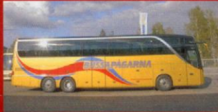
S 416 HDH Bussapågarna, Staffanstorp