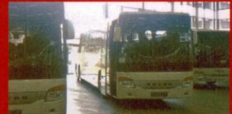
S 419 UL Grimslövsbuss, Grimslov