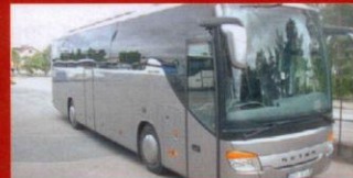
S 415 GT-HD Sparlunds Busstrafik, Grästorp