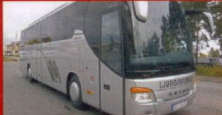
S 415 GT-HD Ljungskilebuss, Ljungskile