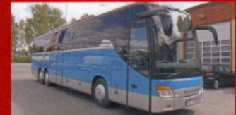
S 416 GT-HD Malmbäck's Buss, Malmbäck

– Jag förväntar mig fortfarande över att jag som mest sitter på kontor kunde konkurrera med proffsen, skrattar han.