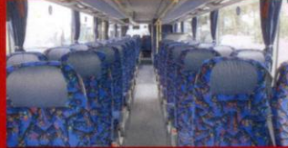
S 416 UL KR Trafik, Östersund