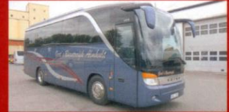
S 411 HD Gerts Busstrafik, Älmhult