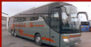
S 416 GT-HD Hjälmäkra Buss, Sävsjö