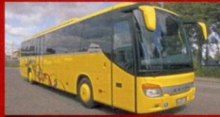
S 416 GT Asige Busstrafik, Slöinge